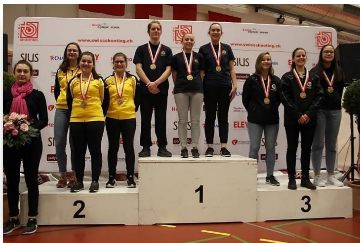
Carabine 10m – Championnat Suisse d'équipes C10 ARQUEBUSE, 3ème, Equipes Juniors