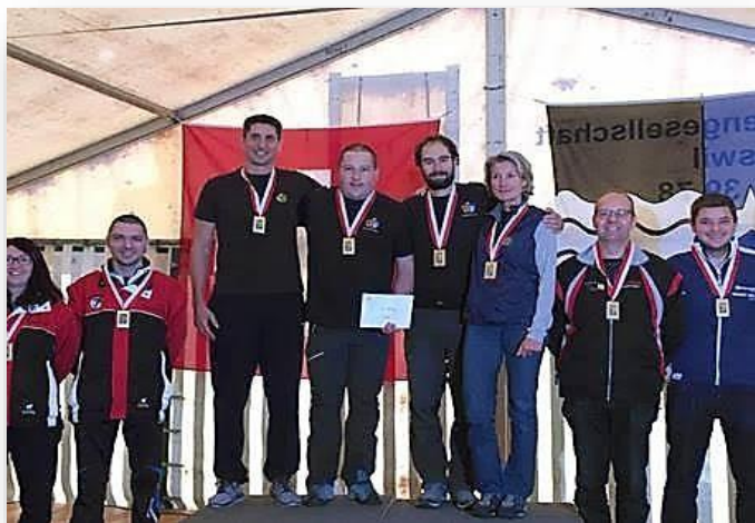
Pistolet 50m – Championnat suisse de groupes P50 ARQUEBUSE, 1ère, Champion Suisse, médaille d'or